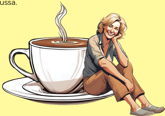
KUVA 5: Opettajan tavoitteet.