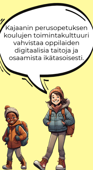
KUVA 3: Perusopetuksen toimintakulttuuri.

Opetuksen tukena voidaan käyttää mm. seuraavia sivustoja: