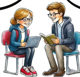
KUVA 6: Tarvittavat tunnuksot ja ohjelmat sujuvaan työskentelyyn.

Muut sovellukset asennetaan KamITin toimesta. Kaupungin tietohallinto huolehtii sovellusten tietosuojan (GDPR) toteutumisesta.