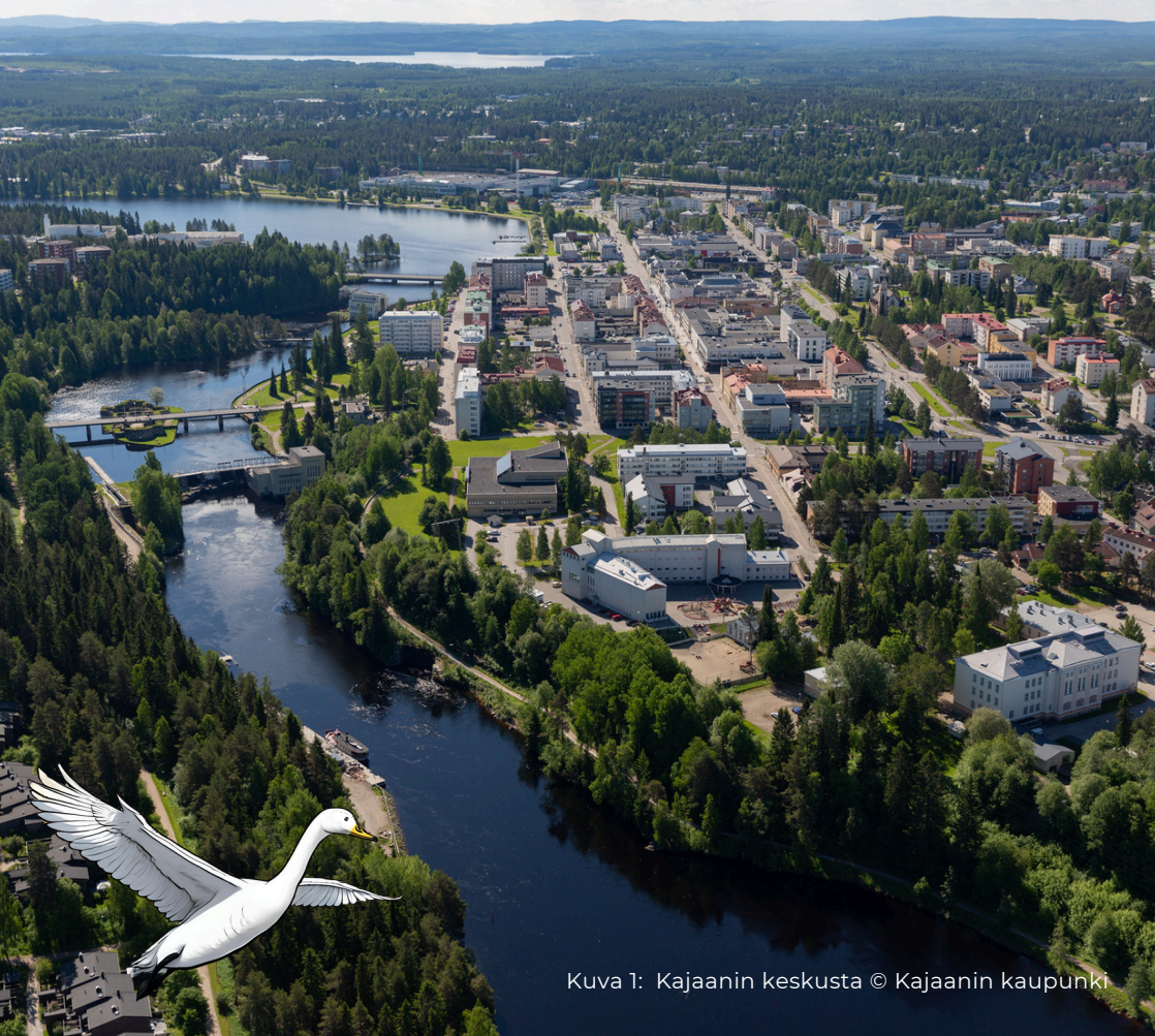
Kuva 1: Kajaanin keskusta