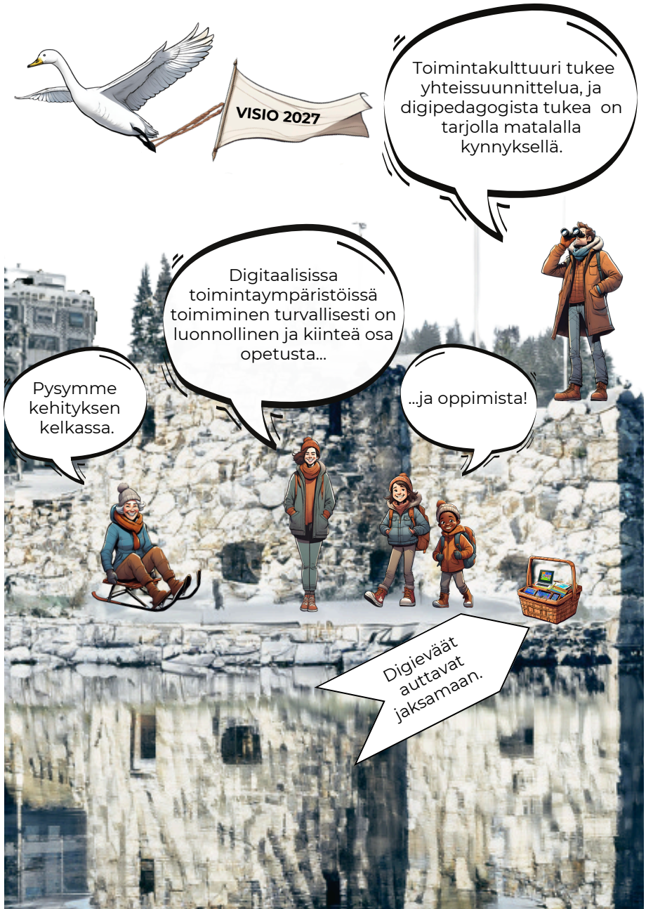
KUVA 2: Kajaanin perusopetuksen digitaalisen osaamisen visio 2027.