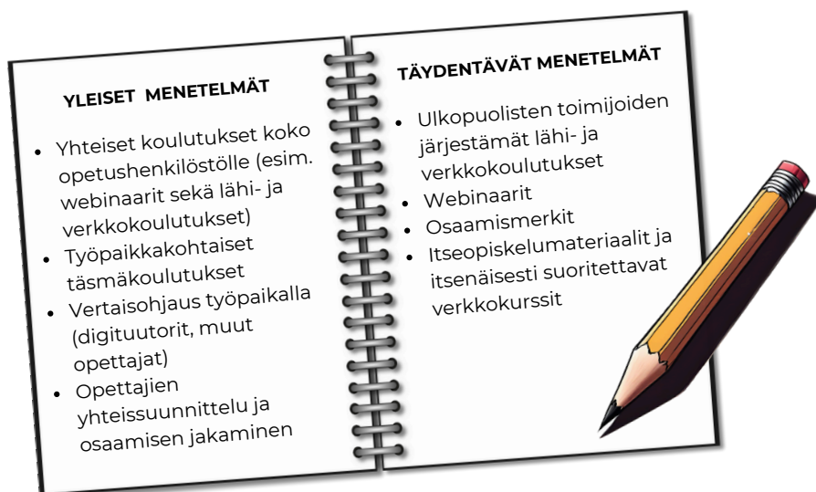
KUVA 7: Opetushenkilöstön osaamisen kehittämisen menetelmät.

4. Jokaisessa koulussa tulisi olla vähintään yksi digituutori, jotta digitaalisen osaamisen kehittäminen olisi mahdollisimman vaikuttavaa. Digituutorin rooli on tarjota pedagogista tukea työyhteisölle sekä auttaa opettajia hyödyntämään digitaalisia työkaluja opetuksessa ja opetuksen suunnittelussa.